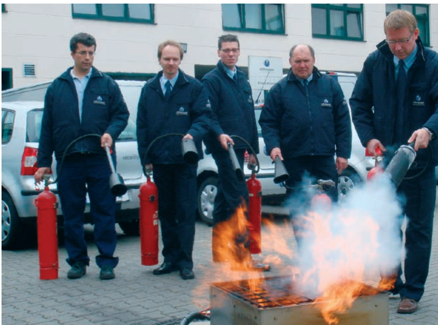
Theoretische und praktische Vorbereitung: Technik schützt nur, wenn die Umsetzung durch geschultes Personal erfolgt.

Als Ende April das Citypalais in Duisburg seine Türen öffnete, lag hinter allen Beteiligten ein wahrer Organisationsmarathon. Für Veranstalter und Betreiber sind mit einer solchen Großeröffnung immer unendlich viele logistische Details zu planen und zu realisieren, um am Ende als Ergebnis eine „runde Sache“ zu erreichen.