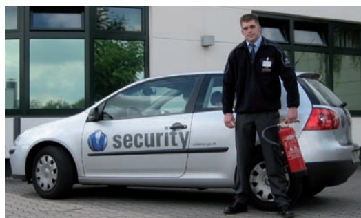
Rund um die Uhr im Einsatz für die Sicherheit.

Veranstalter sollten sich bei der Auftragsvergabe von der Leistungsfähigkeit ihres zukünftigen Partners